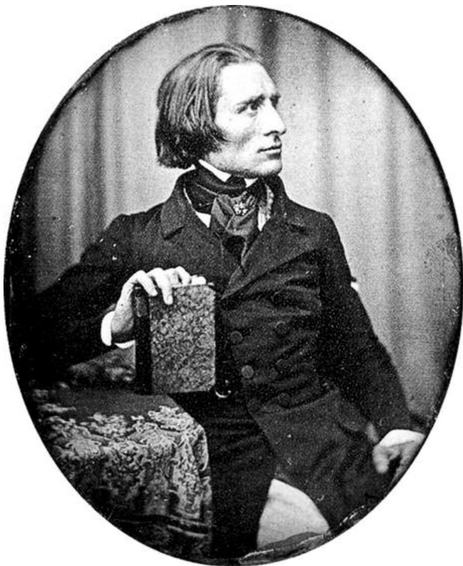
Franz Liszt, dagerotyp Hermana Biow`a z 1843 roku. Franz Liszt, daguerreotype portrait by Herman Biow, 1843.