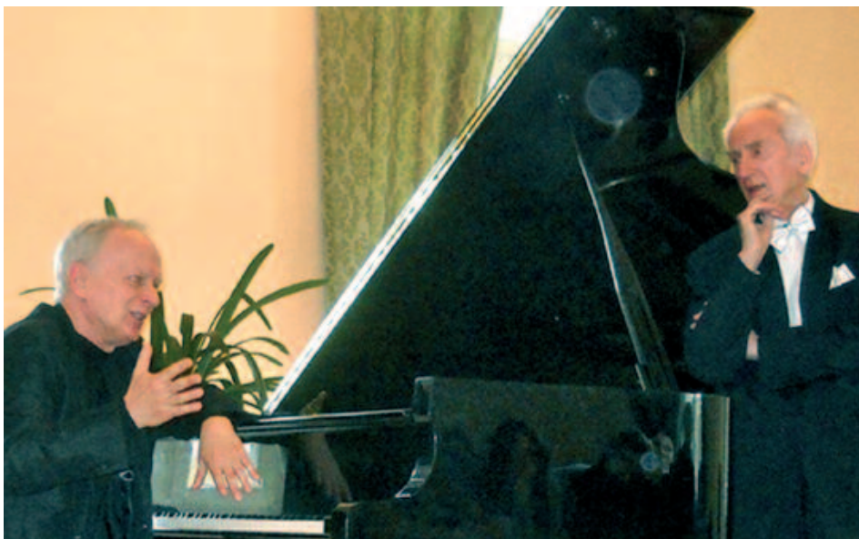
149 Koncert dla młodzieży „Jak słuchać muzyki?” 28.10.2013, z udziałem Janusza Olejniczaka. 149th Concert for the Youth "How to Listen to Music?" 28th Oct 2013 featuring the outstanding Polish pianist – Janusz Olejniczak