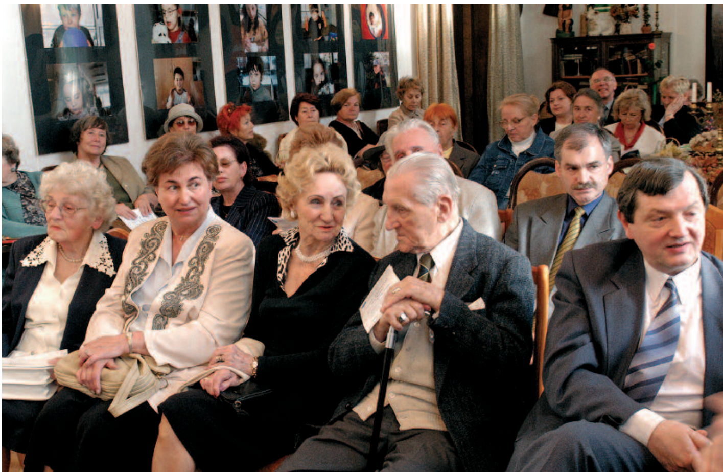
Słuchacze 716 Wieczoru Lisztowskiego - Wrocław, KMil, 24.05.2005. Audience of the 716th Liszt Evening - Wrocław, Music and Literature Club, 24th May 2005.