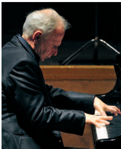
Janusz Olejniczak 24.10.2013. Janusz Olejniczak 24th October 2013.