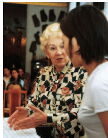
Prof. Halina Czerny-Stefańska